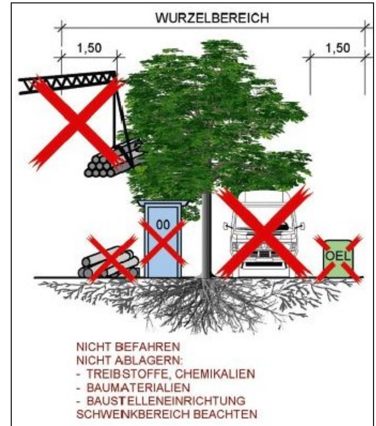
ABBILDUNG 3 WURZELBEREICH © GALK ARBEITSKREIS STADTBÄUME

Es darf in diesem Bereich kein Material abgestellt werden. Vor allem dürfen keine Schadstoffe gelagert werden, bei denen Auswaschungen durch Regen ins Erdreich eindringen oder beschädigte Behälter den Boden mit Schadstoffen kontaminieren können. Auch leichte und ungefährliche Materialien schirmen das Erdreich rund um den Baum vor Regen ab, sodass der Baum nicht mehr genügend Wasser bekommt. Es dürfen weder Fahrzeuge durch diesen Bereich fahren noch schwere Maschinen oder Materialien abgestellt werden. Beides würde den Boden verdichten. Verdichtetes Erdreich führt dazu, dass der Baum nicht mehr genügend Wasser bekommt und langsam abstirbt. Durch Errichten eines soliden Schutzzaunes werden all diese Gefahren für den Baum vermieden.