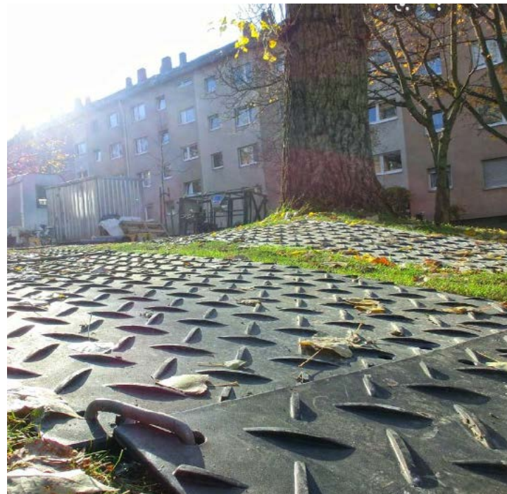
ABBILDUNG 2 BODENSCHUTZPLATTEN