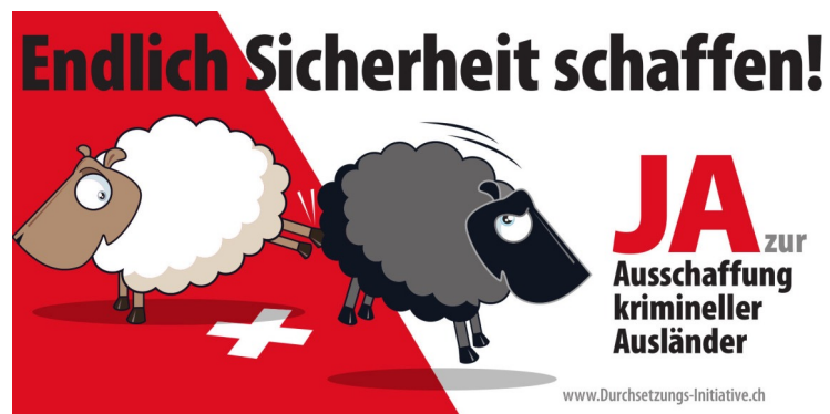
Kampagne der SVP