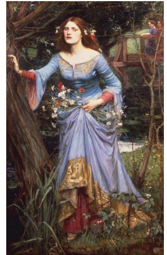
‚tragische Heldin‘, Ophelia